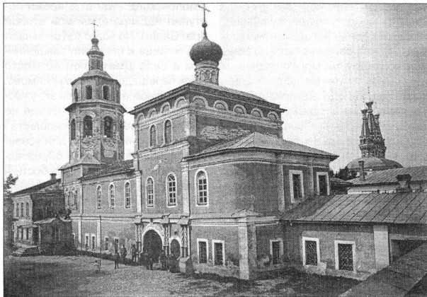
Иоанно-Предтеченский монастырь, в котором располагалось Вяземское духовное училище. Фото начала XX века